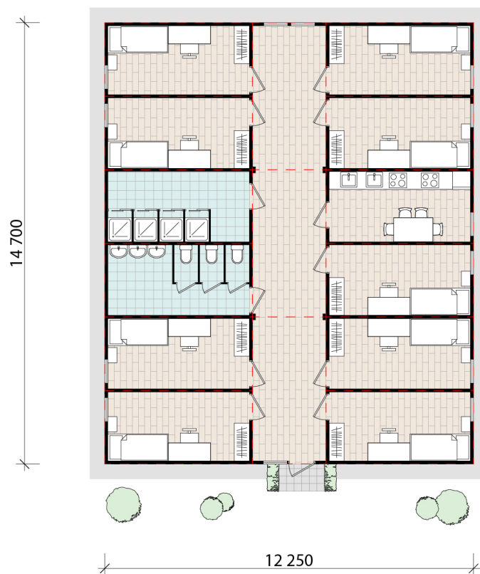
Общежитие КЗ.М6 180 м 2